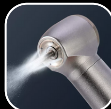
Refrigeración Cuatro Spray